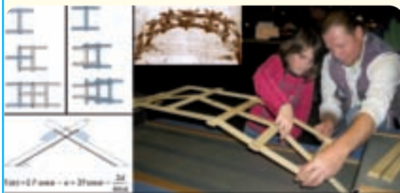
Modèle de Leonard de Vinci

Informations: Technorama Winterthur, Tél. 052 244 08 44, www.technorama.ch