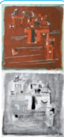
Image du haut : Photo de l'original. Image du bas : Réflectographie à infrarouge. L'ancien motif presque invisible (une femme assise avec une robe à ornements), souligné au crayon et déjà recouvert de couleur, a déjà été peint en partie par l'artiste avec une peinture fine. Seules les couches de peinture épaisses (et mélangées avec le noir) n'ont pas pu être traversées par le rayon infrarouge.

www.swisseduc.ch/chemie/pigmente/pigmente/pulver_alle.html