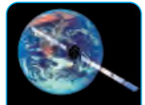
Rosetta prend de l'élan sur la Terre.

www.phim.unibe.ch/rosina/rosina.html et http://rosetta.esa.int/science-e/www/area/index.cfm?fareaid=13