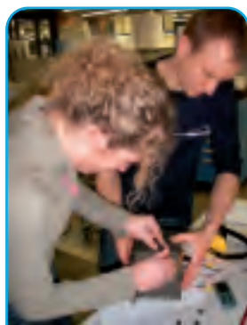
Les étudiants de l'EPF de Lausanne travaillent sur le picosatellite Swisscube

Environ trente étudiants de l'EPF de Lausanne travaillent sur le premier picosatellite du nom de SwissCube. Après la phase actuelle de construction et d'essais, SwissCube sera lancé dans l'espace fin 2008. D'autres universités, hautes écoles spécialisées et l'industrie suisse participent également au projet. Les travaux de recherche donnent aux étudiants la possibilité de nouer des liens importants en tant que futurs «ingénieurs spatiaux». Ils peuvent présenter leurs projets à des experts de l'ESA et de l'industrie spatiale suisse et européenne.