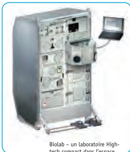
Biolab – un laboratoire High-tech compact dans l'espace