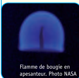
Flamme de bougie en apesanteur.