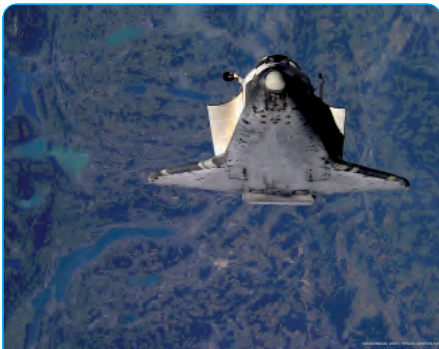
Claude Nicollier à bord de la navette spatiale Discovery au dessus du lac de Zurich.