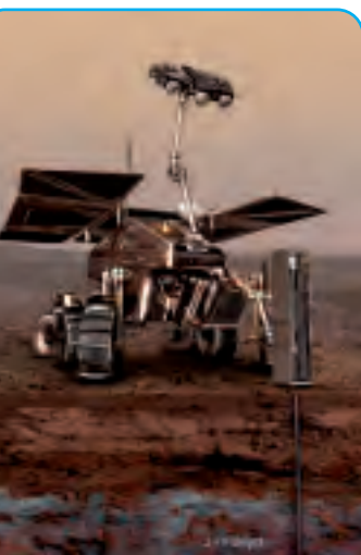
Le Rover d'ExoMars.